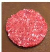
Nuestra hamburguesa de 3 cortes de vacuno 6 unidades