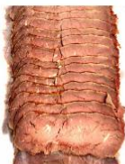
Roast Beef de Lomo laminado 350 g