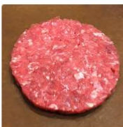
Hamburguesa de vacuno y panceta ahumada 6 unidades